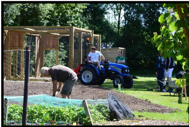
Aanbod van diverse activiteiten

Als de zorgvraag aansluit op het aanbod van onze zorg wordt er een kennismakingsgesprek ingepland. Indien er woonruimte vrij is en de criteria het toelaten, of wanneer je toestemming hebt van je zorginstelling wordt er na een intakegesprek gestart.