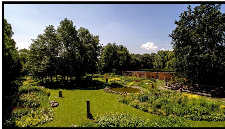
Dagbestedingslocatie Schoolweg 4