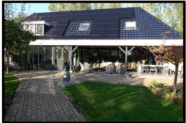
Woonlocatie Schoolweg 4 Andijk

De zorg betreft voor beide locaties 24 uur zorg op afroep.